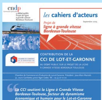
Schéma régional de développement économique

Par ailleurs, la CCI de Lot-et-Garonne a demandé la création d'une gare TGV dans l'agglomération agenaise sur la rive gauche de la Garonne, à proximité de l'échangeur RN 21 et A 62 et proche de l'aéroport. Dans cet esprit, elle a mené une action de lobbying auprès des collectivités locales et des institutions concernées.