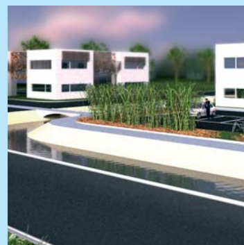
Le projet de zone HQE à Damazan

La Chambre a ainsi fait réaliser diverses études de faisabilité technico-économique, écologique, juridique et urbanistique.