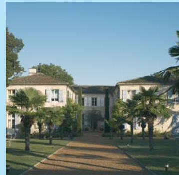
Château de Lassalle à Moirax

L'Hostellerie des Ducs et le Château de Lassalle sont les deux premiers hôtels du département à bénéficier de cette certification qui concerne 221 établissements en France et 67 en Aquitaine. L'opération a été financée en Aquitaine par le Conseil Régional.