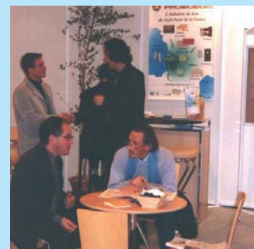
Le stand Promobois à Batimat

Outre PROMOBOIS, plusieurs entreprises ont participé à cette manifestation : BRIOLANCE BOIS, HPK, ISOROY, LESPARE, C2R.