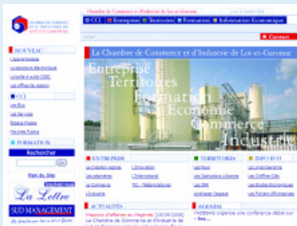
La version 2 du site internet de la CCI 47 a été mise en ligne en octobre 2006.

L'emploi salarié et non salarié dans l'agriculture, l'industrie, la construction, le commerce et les services a fait l'objet d'une analyse en tendance et comparaison avec les évolutions régionales et nationales. Fin 2004, l'emploi total s'élevait à 116 520, soit 9.9% de l'emploi de l'Aquitaine et 0.47% de celui de la France.