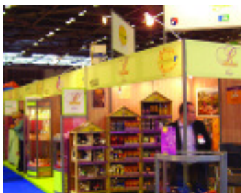
Le stand Prodiaa au SIAL