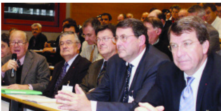
Colloque RN 21 à Périgueux le 20 novembre 2006

→ CPER - Contrat de Projet Etat-Région 2007-2013