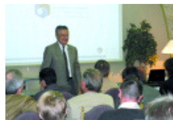
70 chefs d'entreprise du Villeneuvois se sont retrouvés en octobre dernier à St. Sylvestre-sur-Lot

Président de la Chambre de Commerce et d'Industrie de Lot-et-Garonne