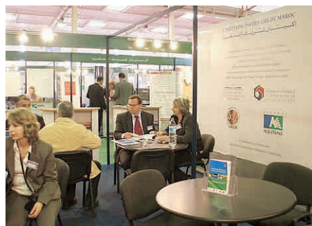
Le stand CCI47 à Med-Allia

La Direction Régionale des Douanes, le Club International des Entreprises de Lot-et-Garonne et la Chambre de Commerce et d'Industrie de Lot-et-Garonne ont présenté aux entreprises le 30 mars dernier, les nouvelles simplifications des procédures douanières.